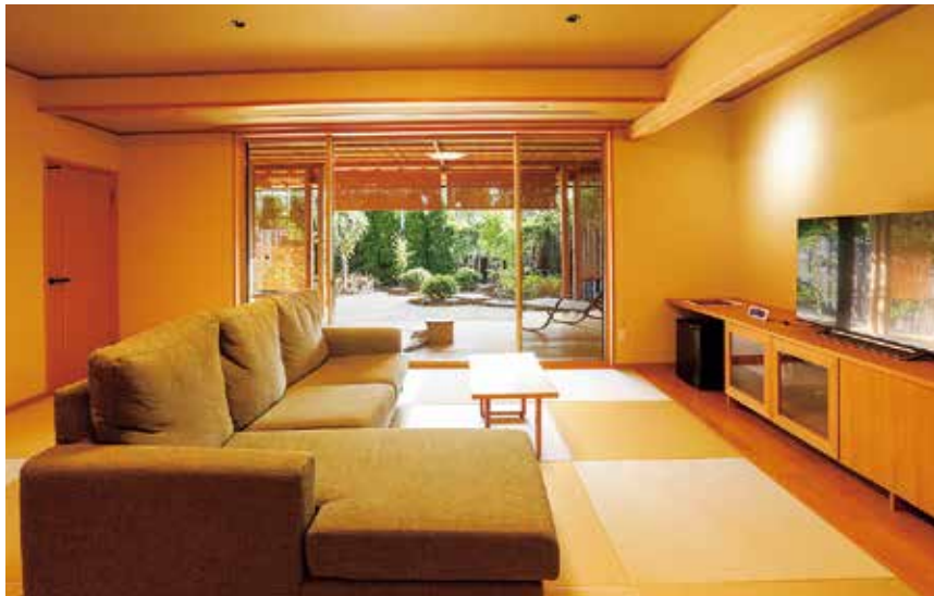
本館ガーデンビュー温泉露天風呂付 離れ特別室