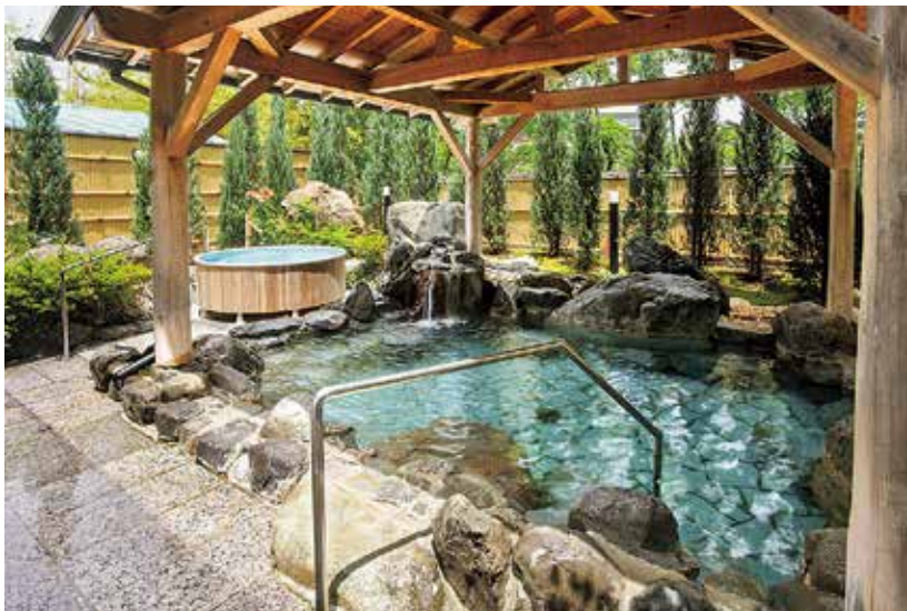
本館大浴場露天風呂