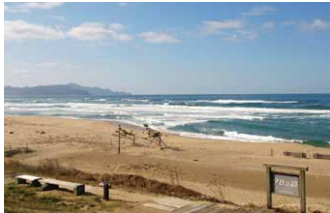
冬の夕日ヶ浦海岸