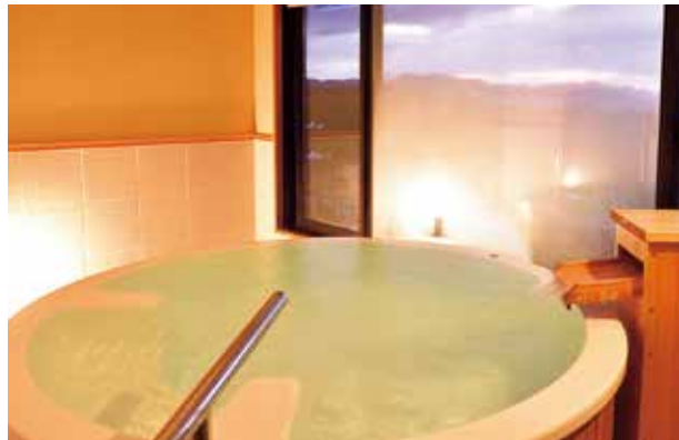
西館スイート温泉風呂