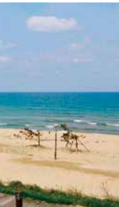
春の夕日ヶ浦海岸