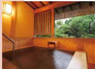
本館西離れ露天風呂付2階