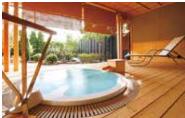
本館西離れ庭園露天風呂付