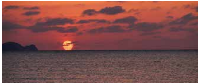
夕日ヶ浦海岸の落日