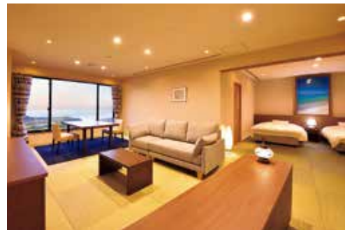
西館オーシャンビュースイート 温泉風呂付