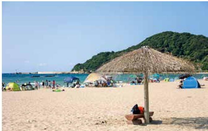
夏の夕日ヶ浦海岸